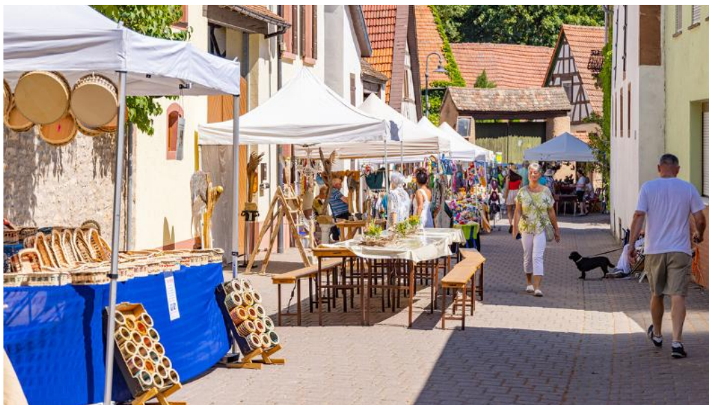
Am Sonntag treffen sich über 50 Ausstellerinnen und Aussteller zum bunten Markttreiben.

Parkplätze (u.a. an der Zellertal-Schule) sind vor Ort ausgeschildert und stehen kostenlos zur Verfügung.