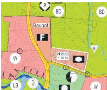
Teilplan Monsheim – Ausweisung