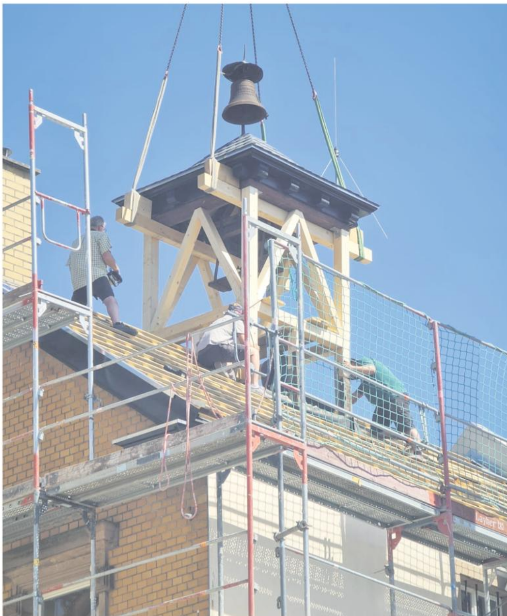
Durch die zusätzliche Sanierung des Uhrenturms des Rathauses in Mölsheim verzögerte sich die Baumaßnahme um mehrere Wochen. Dafür wird das Gebäude nach Abschluss der Sanierung wieder annähernd in seinem Original-Zustand zu bewundern sein.

Die Arbeiten umfassten den Rückbau und die Sicherung der vorhandenen Dacheindeckung, die Demontage der vorhandenen Schalungen und den Rückbau von Dachrinnen und Blitzschutz. Sodann wurden ein Witterungsschutz und eine diffusi-