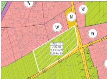
Teilplan Flörsheim-Dalsheim – Rücknahme