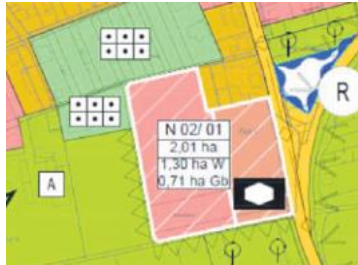
Teilplan Hohen-Sülzen – Ausweisung