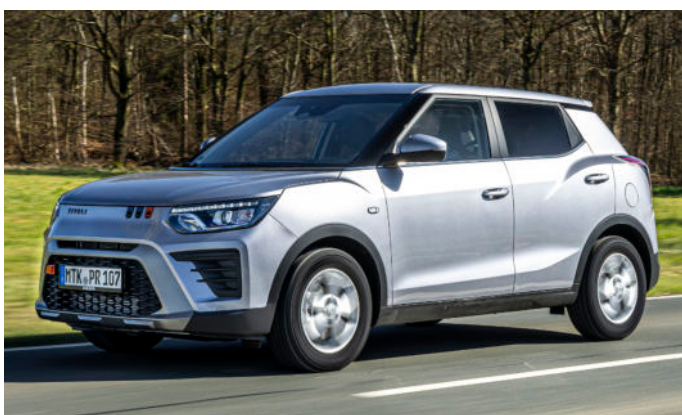
Das City-SUV Tivoli ist auch als Essential Sondermodell bestellbar. Bild zeigt teilweise Sonderausstattung.

Der KGM Tivoli Essential ist sowohl mit Front- als auch mit Allradantrieb erhältlich und bietet damit Flexibilität für Alltag und Freizeit. Mit seinem effizienten Antrieb, kompakten Abmessungen und hohem Komfort eignet sich das vielseitige SUV ideal für Stadtverkehr und längere Fahrten gleichermaßen.