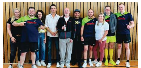
Die Mannschaft mit einem Teil der mitgereisten Unterstützer.

Eine gute Saison für die erste Herrenmannschaft des TSV geht zu Ende und wir schauen gespannt auf die Veränderung der anstehenden Saison 2026/27.