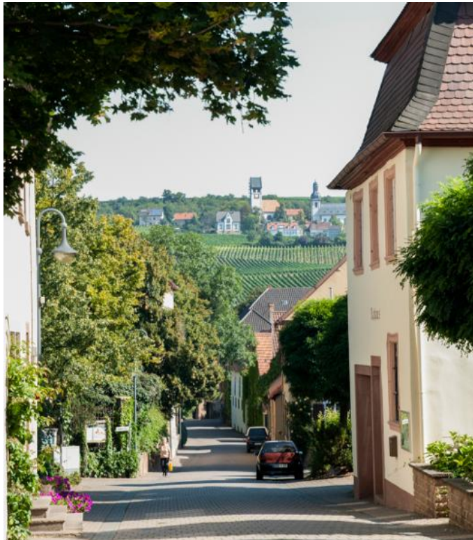
Der Harxheimer Ortskern mit Blick auf Zell

Die Hauptstraße weist in diesem Jahr einen ganz besonderen optischen Leckerbissen auf. Lassen Sie sich überraschen! Wie immer prägt das Motto „Kunst und Wein“ die Veranstaltung, Zeller-taler Winzer, mit ihren hervorragenden Produkten aus ihren Kellern und Gastronomen bieten mit ihren Helfern Speisen und Getränke, sowie ein musikalisches Rahmenprogramm, an.