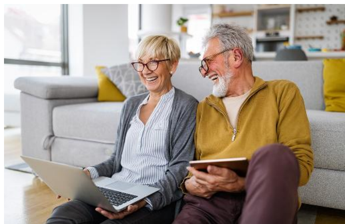
2.000 € steuerfrei pro Monat – Wer über die Regelaltersgrenze hinaus arbeitet, kann die Aktivrente in Anspruch nehmen.

Alle Ausgaben unter www.vg-monsheim.de/ amtsblatt