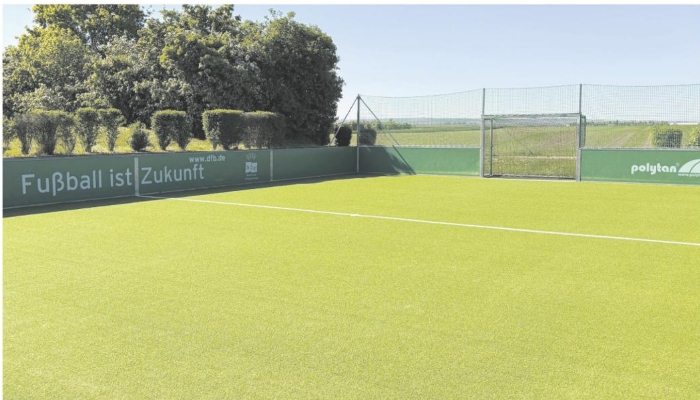
Das beliebte Kleinspielfeld am Offsteiner Grillplatz hat einen neuen Sportbelag und wurde von Grund auf saniert.

In einer Gemeinschaftsaktion von Gemeinde und TuS Offstein wurde das Projekt damals angegangen. Die Gemeinde brachte den Grund- und Boden auf dem zentral gelegen Grillplatz ein. Der TuS Offstein stellte die finanziellen Mittel für die Herichtung der Bodenplatte zur Verfügung und erweckte mit vielen freiwilligen Helfern in ca. 850 teilweise schweißtreibenden Arbeitsstunden das Kleinspielfeld im Jahr 2009 zum Leben. Seit fast zwei Jahrzehnten diente das Spielfeld unzähligen Kindern, Jugendlichen und Erwachsenen als Treffpunkt für Sport und Freizeit. Auch die JSG Wonnegau nutzte es regelmäßig für das Training und kleinere Turniere der Bambini-Mannschaften. Nach intensiver Nutzung und leider auch einigen mutwilligen Beschädigungen war der Zustand des Spielfelds jedoch zuletzt nicht mehr tragbar. Der Belag war stark abgenutzt, die Netze beschädigt und die Spielfläche insgesamt nicht mehr sicher. Eine grundlegende Sanierung war notwendig, um den Platz weiterhin nutzen zu können. Dank der Sportstättenförderung des Landes Rheinland-Pfalz konnte die Ortsge-