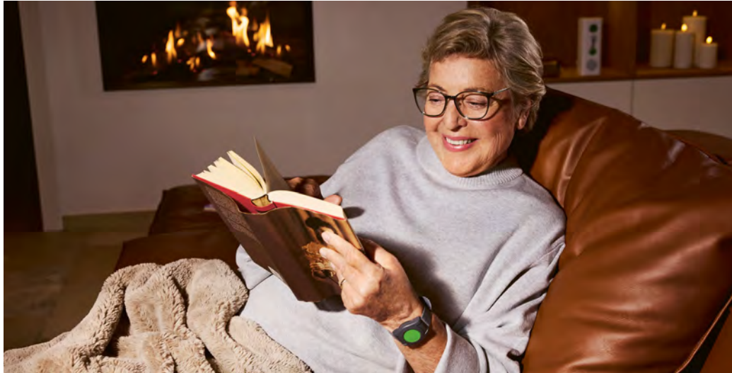
"Lindenstraße"-Star Marie-Luise Marjan plädiert für Sicherheit: Mit dem Notrufknopf am Armband oder einer Halskette ist man immer für Notfälle gerüstet.

(DJD). Allein in den eigenen vier Wänden zu leben – für die meisten älteren Menschen ist das ein wichtiges Stück Freiheit. Die vertraute Umgebung, der gewohnte Tagesrhythmus und die Selbstbestimmtheit schaffen Sicherheit und Lebensqualität. Doch zugleich kennen viele diese leise Stimme im Hinterkopf: Was, wenn etwas passiert und niemand in der Nähe ist? Diese Sorge teilen sowohl Betroffene als auch Angehörige, die oft nicht rund um die Uhr erreichbar sein können.