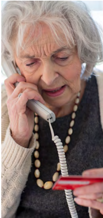
Bankkundinnen und -kunden sollten niemals Zugangsdaten oder PINs an dritte Personen weitergeben.

(DJD). Betrügerische Anrufe treffen besonders häufig ältere Menschen. Die Täter geben sich etwa als Enkelkind aus, täuschen eine Notlage vor und wollen die Angerufenen zu Geldüberweisungen bewegen. Neben dem Enkeltrick gehören auch Schockanrufe, telefonische Gewinnversprechen, Anrufe falscher Polizeibeamter oder vermeintlicher Microsoft-Mitarbeiter zu den gängigen Maschen. Der Bundesverband der Deutschen Volksbanken und Raiffeisenbanken hat Hinweise zusammengestellt, woran sich solche Betrugsversuche erkennen lassen und was im Ernstfall zu tun ist.