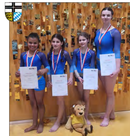
Bericht & Foto: Ronja Dürkes-Hein

Herzlichen Glückwunsch an alle Turnerinnen, ihr könnt stolz auf euch sein!