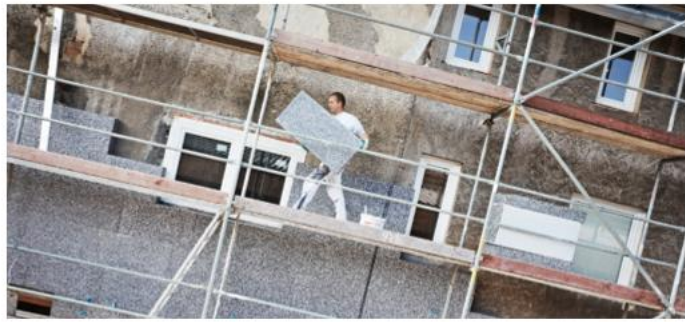
Im Mittelpunkt der Kreisprojekte stehen Investitionen in Klimaschutz und Gebäudesanierung

38 Millionen Euro für Zukunftsprojekte: Kreisausschuss stimmt für regionales Umsetzungskonzept - Der Landkreis Alzey-Worms hat die Schwerpunkte für seinen Anteil am Sondervermögen „Rheinland-Pfalz-Plan für Bildung, Klima und Infrastruktur“ festgelegt. Einstimmig votierten die Mitglieder des Kreisausschusses für das vorgelegte regionale Umsetzungskonzept. Von dem auf die Region entfallenden Gesamtbudget in Höhe von rund 114 Millionen Euro sollen 38 Millionen Euro direkt in Projekte des Landkreises fließen. Die übrigen Mittel werden auf die Städte und Verbandsgemeinden verteilt. Im Mittelpunkt der Kreisprojekte stehen Investitionen in Klimaschutz, Gebäudesanierung, Gesundheitsversorgung, Katastrophenschutz, Verkehrsinfrastruktur und digitale Verwaltungsangebote. Den größten Einzelposten bildet mit 20 Millionen Euro die Modernisierung kreiseigener Verwal-