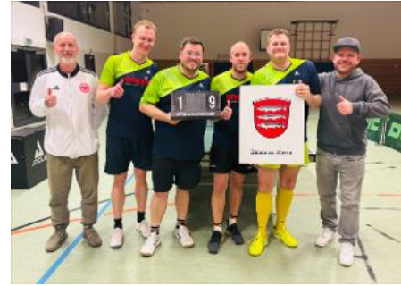
Die erste Mannschaft und Freunde nach dem 9:1 Auswärtssieg

Mit großer Spannung war am letzten Donnerstag das Spiel in Hamm am Rhein gegen den dort heimischen TTC Altrhein erwartet worden. Hatte doch am Tage zuvor der Tabellenzweite beim Tabellenführer verloren und wir hatten die Chance nun selbst auf den Tabellenplatz aufzusteigen und uns damit noch für die Relegationsspiele am 09.05. zu qualifizieren.