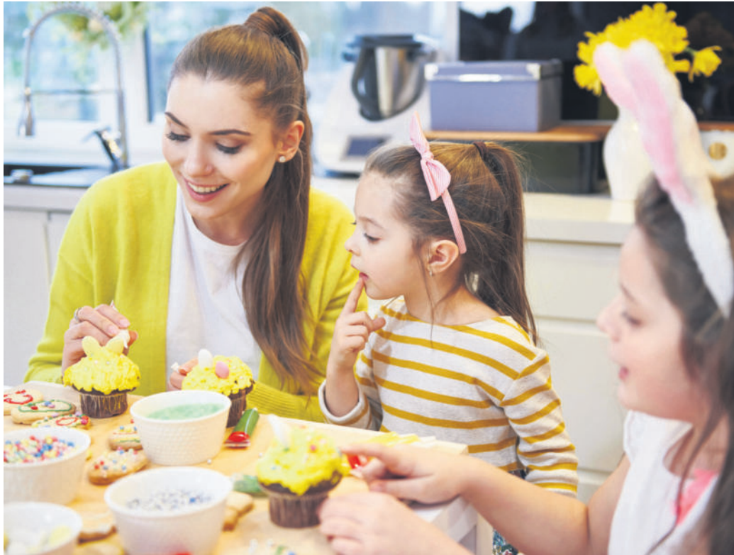
Vielfältige traditionelle Leckereien aus der Osterbäckerei versüßen uns das Osterfest.

Wissenswertes rund um die Backtraditionen zum Osterfest