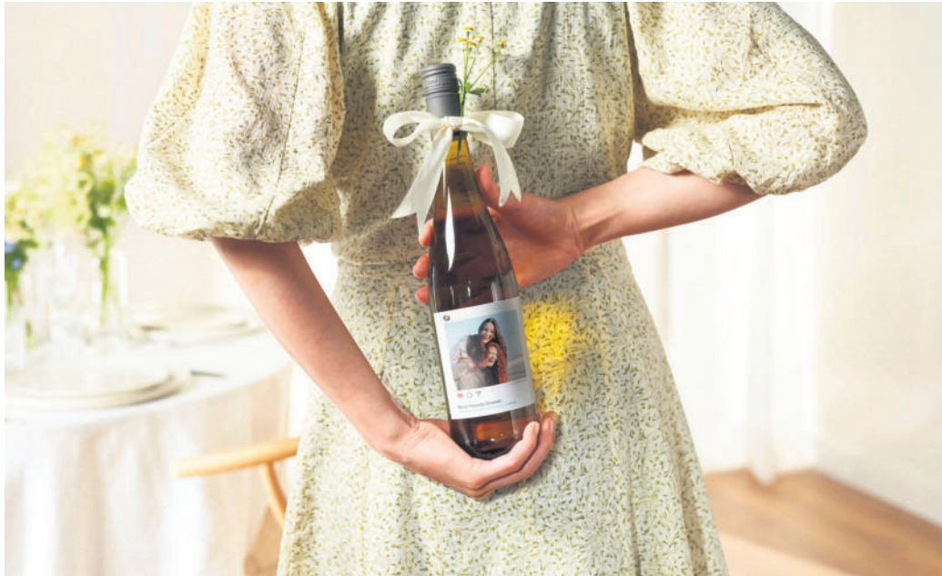
Aufmerksamkeit mit Aha-Effekt: Ein individuell gestaltetes Etikett wertet jede Flasche auf.

Aus Fotoschnappschüssen originelle Präsente gestalten