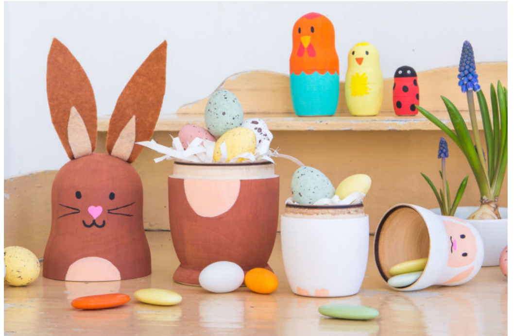
Überraschung: Aus manchen Osterhasen kommen Eier, aus anderen schlüpft ein Lamm, ein Huhn, ein Küken, ein Marienkäfer.

Niedliche Figuren mit Überraschungseffekt – ganz einfach selbst gemacht