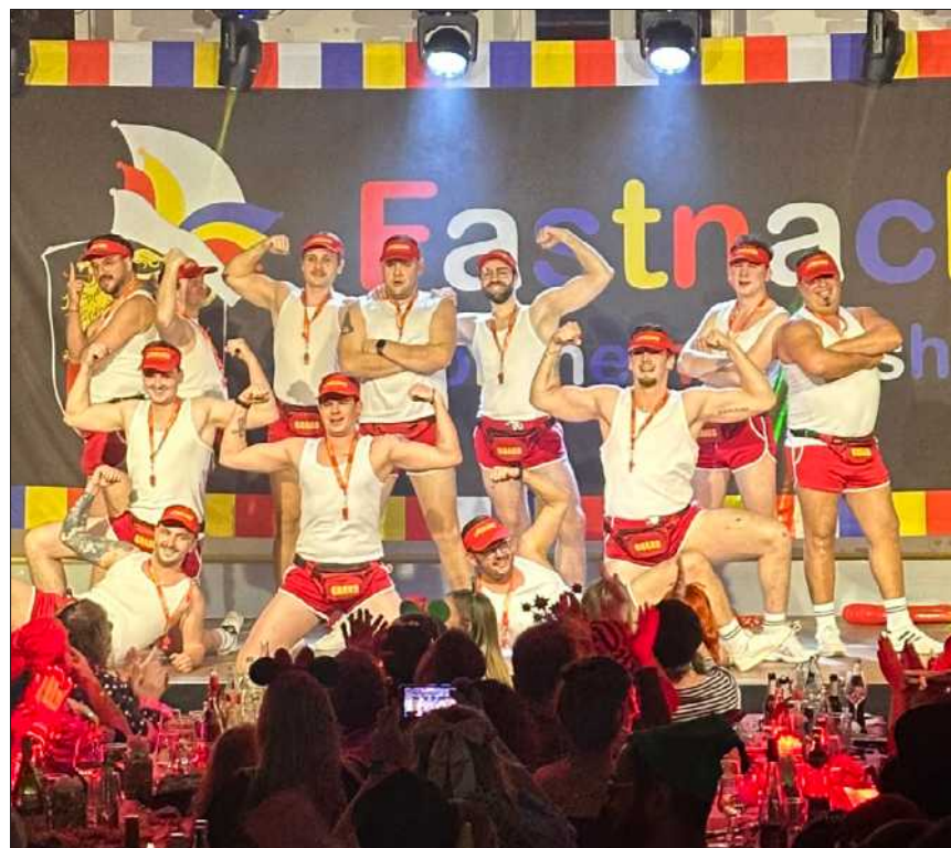
Die „Zuckerpuppen“ aus Flörsheim-Dalsheim sorgten als Rettungsschwimmer im augenzwinkernden „Baywatch“-Look für einen der tänzerischen Höhepunkte der Fastnachtssitzung im Bürgerhaus.