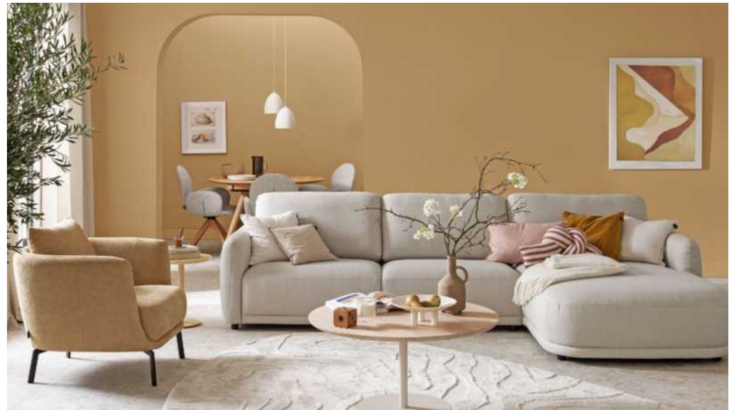
Warme Naturtöne bringen ein edles Ambiente und viel Behaglichkeit ins Zuhause.