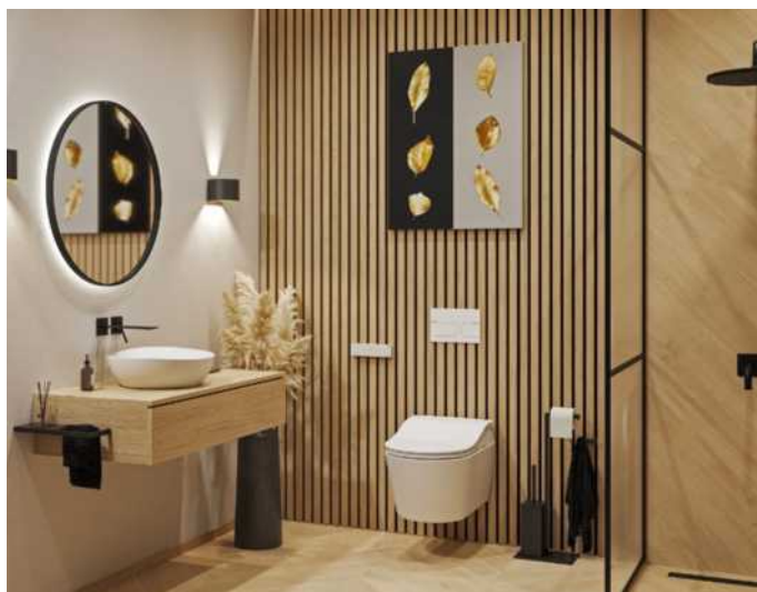
Mit einem Dusch-WC wird das Badezimmer zum Wohlfühlort: Die Intimreinigung mit sauberem, warmem Wasser sorgt für ein Gefühl von Frische und Reinheit.

(DJD). Wer heute sein Badezimmer renoviert, denkt längst nicht nur an Stil und Design. Auch Komfort und Barrierefreiheit spielen eine immer größere Rolle. Schließlich soll das Bad nicht nur heute, sondern auch morgen ein Ort sein, an dem man sich gerne aufhält – unabhängig vom Alter oder der körperlichen Verfassung. Ein Highlight moderner Badgestaltung ist das Dusch-WC, wie es zum Beispiel vom japanischen Hersteller Toto unter dem Namen Washlet angeboten wird. Das WC mit Bidetfunktion vereint Hygiene, Komfort und Wohlbefinden. Die Intimreinigung mit sauberem, warmem Wasser sorgt für ein Gefühl von Frische und Reinheit und ist darüber hinaus hygienischer als die mit Toilettenpapier. Zusätzliche Funktionen wie ein beheizbarer Sitz, eine Ladydusche oder die Bedienung per Fernbedienung machen den täglichen Gang zur Toilette noch komfortabler. Ein Dusch-WC lässt sich nicht nur in Neubauten, sondern auch nachträglich in bestehende Badezimmer integrieren. So kann man etwa bei der Renovierung die nötigen Anschlüsse einplanen, damit geschulte Fachkräfte später problemlos das vorhandene WC