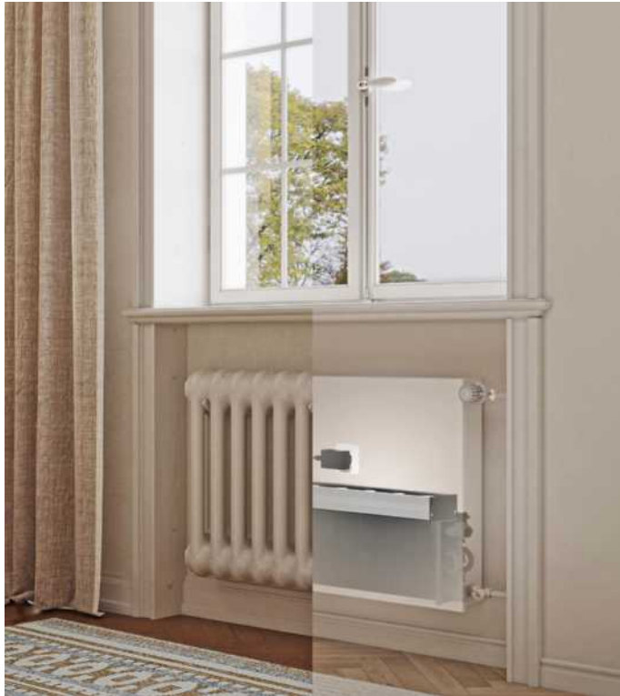
Dank standardisierter Anschlüsse können Austauschheizkörper ganz einfach anstelle der alten Geräte eingebaut werden.

Niedertemperaturheizkörper sparen Energie und steigern die Wärmepumpen-Effizienz