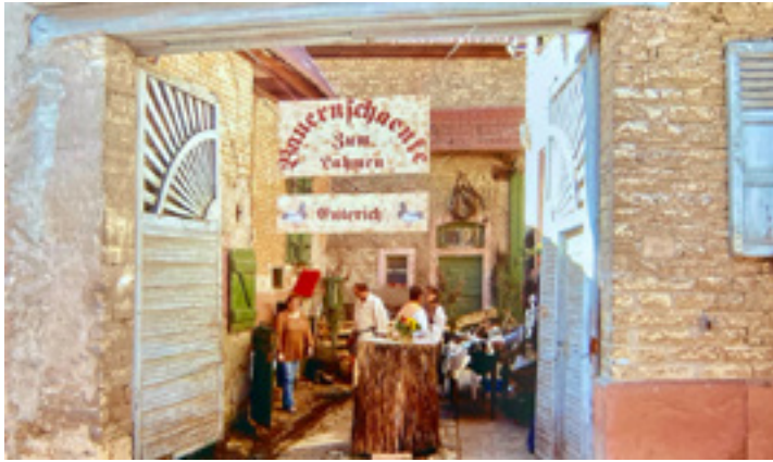
Bild vom Fleckenmauerfest 2016 „Zum Lahmen Enterich“