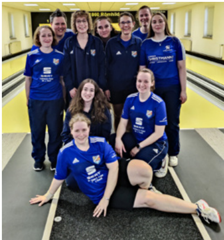
1. Damenmannschaft spielt 2. Bundesliga! (Foto: SKC Monsheim)

Nun war klar, Dana muss diesen kleinen Vorsprung halten und dann hätte man es geschafft. Dana maß sich mit der Gegnerin auf Platz 3 auf Augenhöhe. Beim vorletzten Wurf, mit 8 Kegeln vor dem 3. Platz, war klar: Wir haben es geschafft. Liga 2 – Monsheim ist dabei!