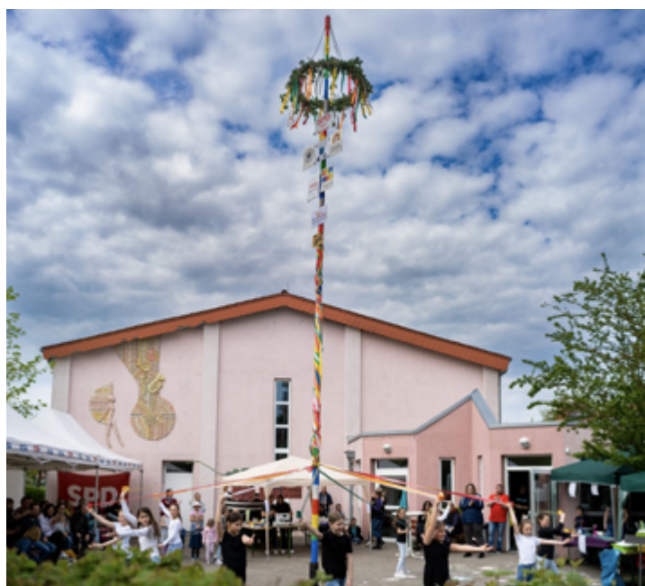
Aufstellen des Maibaumes 1.5.2023

Am „Tag der Arbeit“ möchten wir alle Besucher und Besucherinnen ab 11 Uhr zu einem gemütlichen Beisammensein am Dorfgemeinschaftshaus einladen. Auch in diesem Jahr wird von der SPD traditionsgemäß wieder ein Maibaum vor dem DGH aufgestellt. Die Regenbogentänzer des TV Mörrstadt unterstützen dies durch einen Tanz.