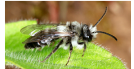
Männchen der Gauschwarzen Düstersand- biene.

Wildbienen erfüllen eine allgemein wichtige Aufgabe in intakten Ökosystemen. Der Vortrag findet im Sängerheim statt, das im Orts- teil Dalsheim am Untertor liegt. Anstatt einer Teilneh- mergebühr, besteht die Möglichkeit für den NABU zu spenden. Weitere Informationen ger- ne bei Ute Frey (06243 / 905982) und Gerd Reder (06243 / 8312). Wir freuen uns auf viele interessierte Gäste. Mit freundlichen Grüßen