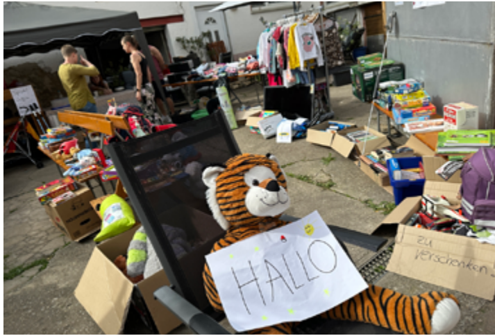
Zahlreiche Bürgerinnen und Bürger beteiligten sich am „1. Flörsheim-Dalsheimer Dorrflohmarkt“ und sorgten so für gute Stimmung und viel Besucherverkehr in der Doppelgemeinde.