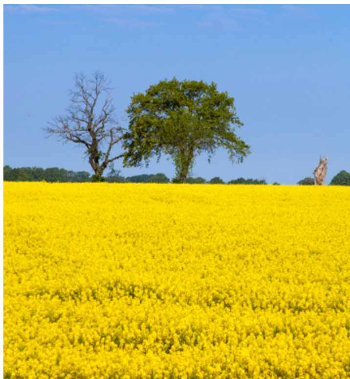
Einheimische Rapsäcker leisten einen wichtigen Beitrag zur Herstellung umweltverträglicher Kraftstoffe.

Fahrzeughalter können wie bisher an allen Tankstellen den gewohnten Standard-Dieselsort B7 tanken. Ob die Tankstellenbetreiber den klimafreundlicheren Kraftstoff B10 anbieten, können sie individuell entscheiden. Es besteht keine Ver-