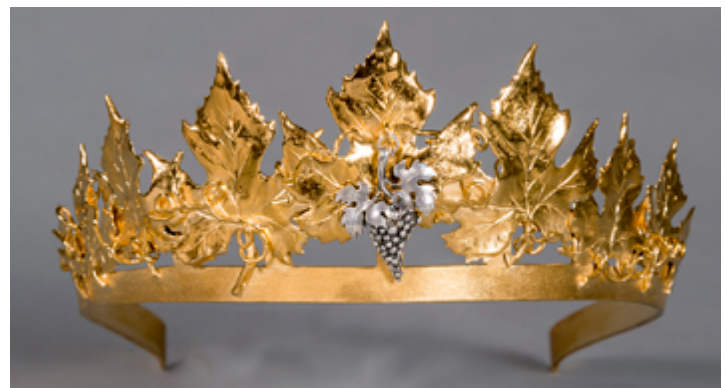
Krone der Rheinhessischen Weinkönigin.

Die Gebietsweinwerbung Rheinhessenwein e.V. sucht interessierte Kandidaten (w/m/d), die sich um die Nachfolge der amtierenden Weinmajestäten bewerben und sich dem Wettbewerb um die Krone stellen.