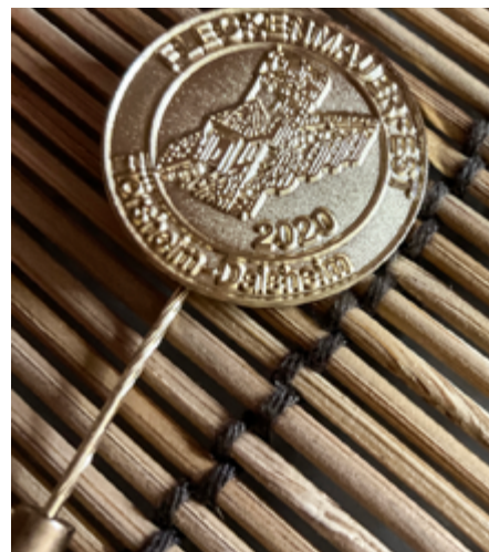
Die begehrte goldene Anstecknadel