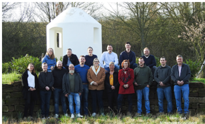
Die Kandidaten und Kandidatinnen der LuK Monsheim-Kriegsheim