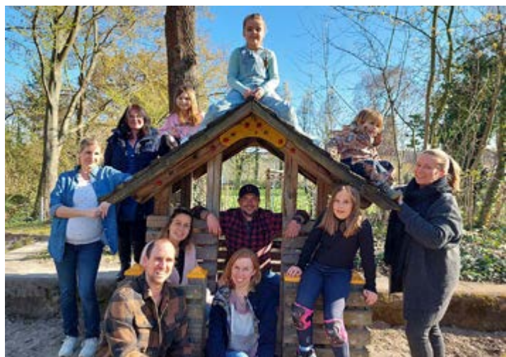
Gründer FamilienLeben Hohen-Sülzen, April 2023

Wir sind die Gründer eines neuen Vereins in Hohen-Sülzen, der Familien eine Stimme gibt. Es ist unser Ziel, das Zusammenleben in unserem Dorf durch verschiedene Aktivitäten attraktiver zu gestalten.