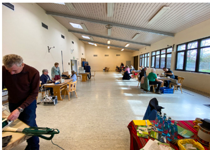
Unser letzter Reparatur-Treff in Hohen-Sülzen am 25.2.23