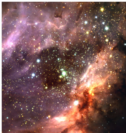
Omeganebel