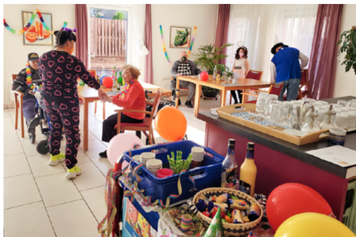
Erste Gäste finden sich zur Karnevalsfete am Rosenmontag ein und die mobile Cocktailbar steht schon bereit.