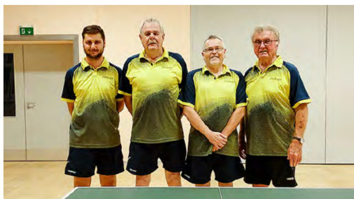
Die dritte Mannschaft der SG Offstein Wachenheim.