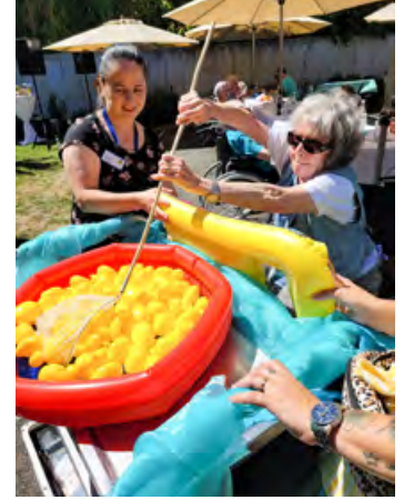
Beim Entenangeln wurde alles gegeben!

für ein leckeres Eis. Das AZURIT Catering-Team kümmerte sich um das leibliche Wohl und sorgte mit schmackhaften Spezialitäten frisch vom Grill, Gemüsespießen, tollen Salaten und kühlen Getränken dafür, dass niemand hungern