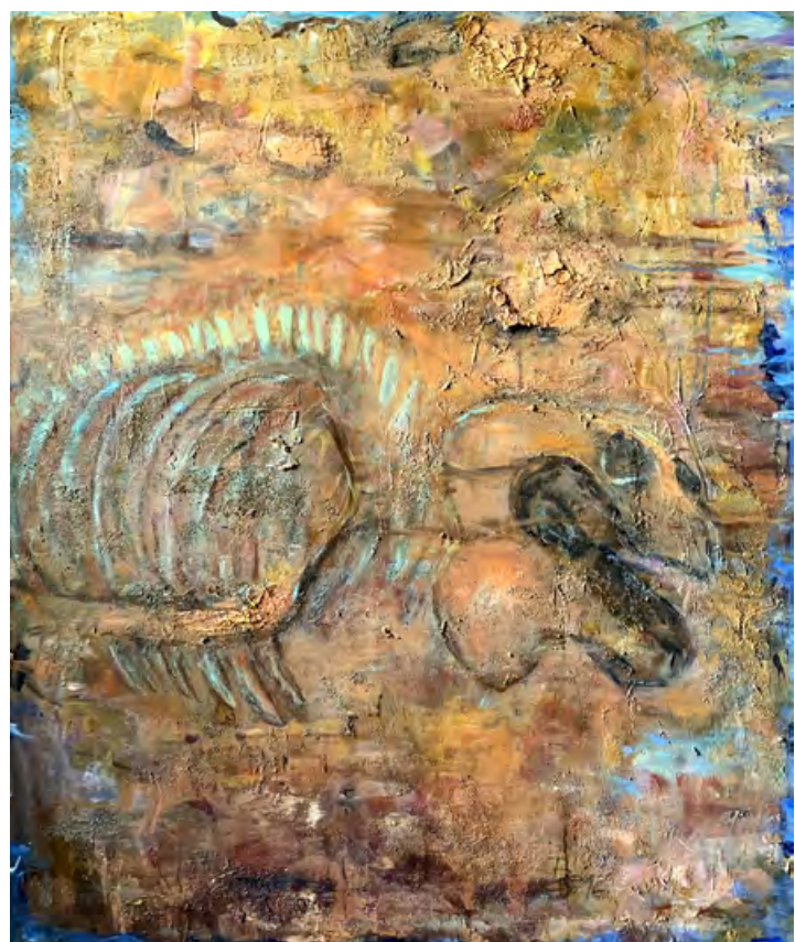
TERRA INCOGNITA, Acrylmischtechnik, 100cm x 120cm, 2016