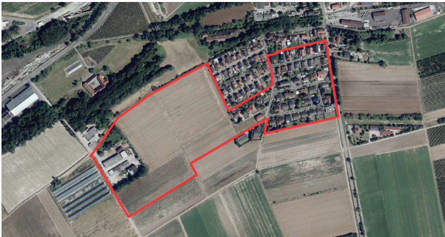
Abb.: Luftbild (Stand August 2022)

Der Geltungsbereich umfasst eine Fläche von rd. 10,3 ha.