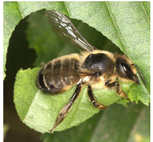
Weibchen der Garten-Blattschneiderbiene bei der Arbeit.

Mittels eindrucksvollen Lebendfotos wird die Artenvielfalt der heimischen Wildbienen und deren Lebensweise dargestellt. Nach derzeitigem Kenntnisstand sind in Rheinland-Pfalz über 468 verschiedene Arten von