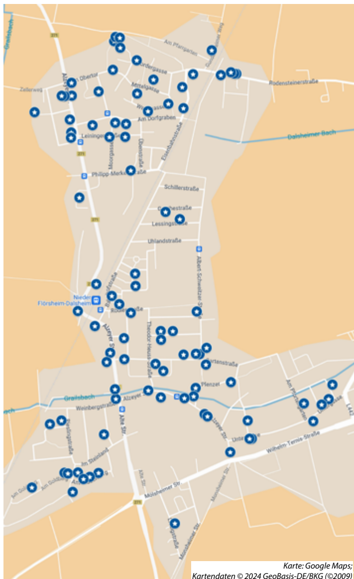
Karte: Google Maps; Kartendaten © 2024 GeoBasis-DE/BKG (©2009)

Zusätzlich haben „Göhring’s Weinkehr“ (Alte Straße – direkt an der B271) ab 14h und das „Wingertsheisje“ (am Goldbergbrunnen) des Landrestaurants Tacheles ab 11h an diesem Tag geöffnet. Viel Spaß beim „1. Flörsheim-Dalsheimer Dorfflohmarkt“!