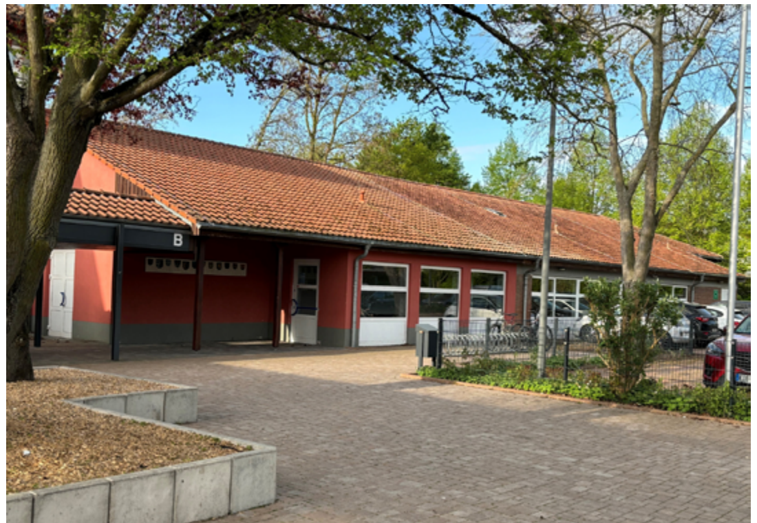
Das Nebengebäude der Realschule plus in Flörsheim-Dalsheim könnte aufgestockt werden, um vier neue Klassenräume zu schaffen.

Die ursprünglich mit nur acht Klassenräumen errichtete Schule war in den 1980er Jahren umgebaut worden. Wegen der damals rückläufigen Schülerzahlen hatte man im Klassentrakt Wände versetzt und dadurch die Zahl der Klassenräume auf zehn erhöht, welche teilweise jedoch nur eine geringe Raumgröße aufweisen und somit für die nun wieder größeren Klassen nicht mehr ausreichen.