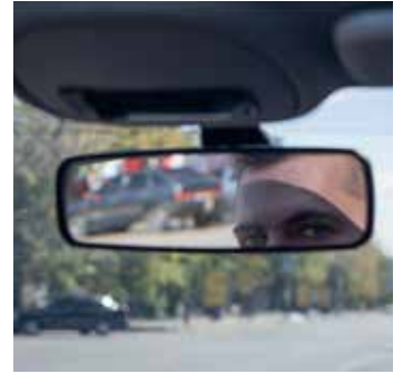
Vor Abbiegen und Spurwechsel immer der Blick in den Spiegel plus Schulterblick!

jeder Fahrt kontrollieren und gegebenenfalls neu einstellen. Wichtig: Der Blinker ist kein Freifahrtschein! Vor Abbiegen und Spurwechsel also immer in den Rückspiegel schauen plus Schulterblick. Will man abbiegen, sollte man Fuß- und Radwege im Blick behalten und sich vor dem Aussteigen aus dem Auto vergewissern, dass man die Tür gefahrlos öffnen kann. Einige Fahrzeuge sind mit Technologien wie Toter-Winkel-Assistent oder Spurwechselassistent ausgestattet. Diese Systeme verwenden Sensoren, um die Umgebung des Fahrzeugs zu überwachen und Warnung zu geben. In manchen Autos ist ein solcher Assistent schon verbaut. Nachgerüstet werden kann er auch. Und dennoch: Den Schulterblick erspart er nicht. Fußgänger sollten, wenn sie die Straße überqueren, immer vorsichtig sein. Wenn möglich, Blickkontakt zum Fahrer aufbauen. Radfahrer sollten sich nicht auf einen gesetzten Blinker verlassen und einen Blick in den Außenspiegel des Fahr-