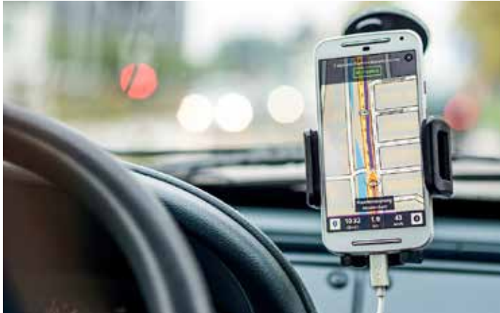
Immer mehr Menschen fühlen sich mit der Bedienung der Navigation überfordert.

(mid/ak-o) Die integrierten Bildschirme für das Navigationssystem werden in Fahrzeugen immer größer. Statt nur die optimale Route vorzuschlagen, bieten sie ein komplettes Entertainmentsystem. Immer mehr Menschen fühlen sich mit der Bedienung überfordert. In einer Testreihe stellte die Dekra im kürzlich veröffentlichten Verkehrssicherheitsreport fest, dass die Probanden bei einem Fahrzeug mit Touchscreen im Durchschnitt deutlich mehr Zeit benötigten, um verschiedene Funktionen einzustellen, als im Vergleich bei einem Auto mit Knöpfen und Schaltern.