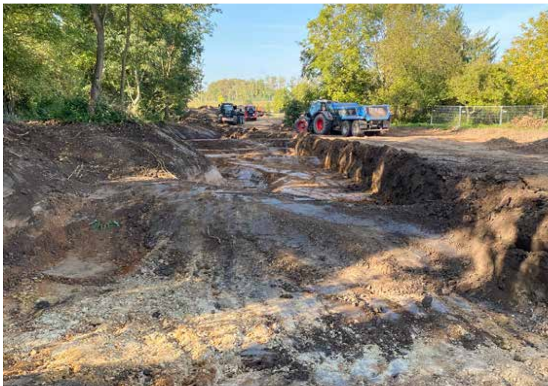
Westlich von Offstein sind die Arbeiten zur Renaturierung eines Abschnitts des Eisbachs bereits in vollem Gange.