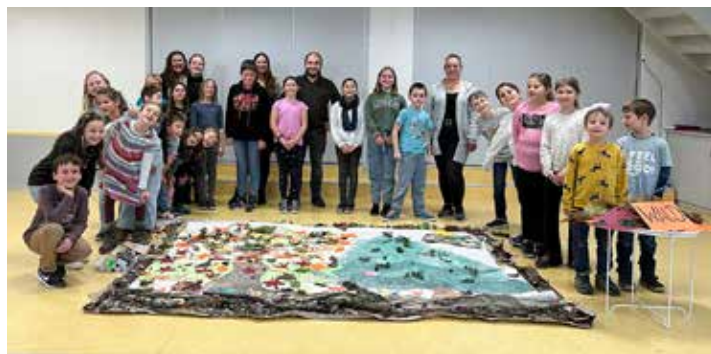
Kinder und Betreuersteam beim gemeinsamen Abschluss im Bürgerhaus Flörsheim-Dalsheim.