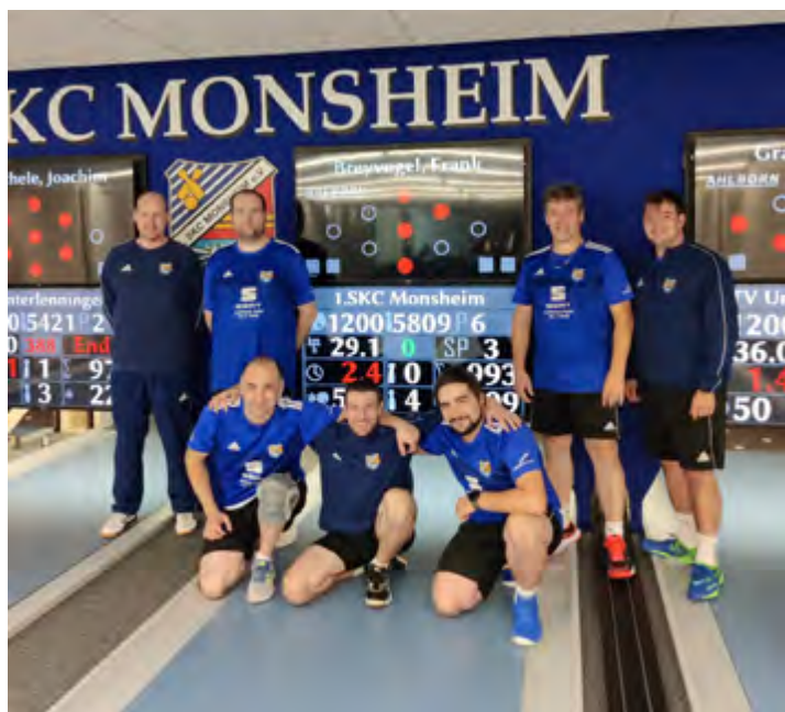
SKC Monsheim 1. DCU Mannschaft spielt mit 5809 Kegeln den ersten offiziellen Bahnrekord.