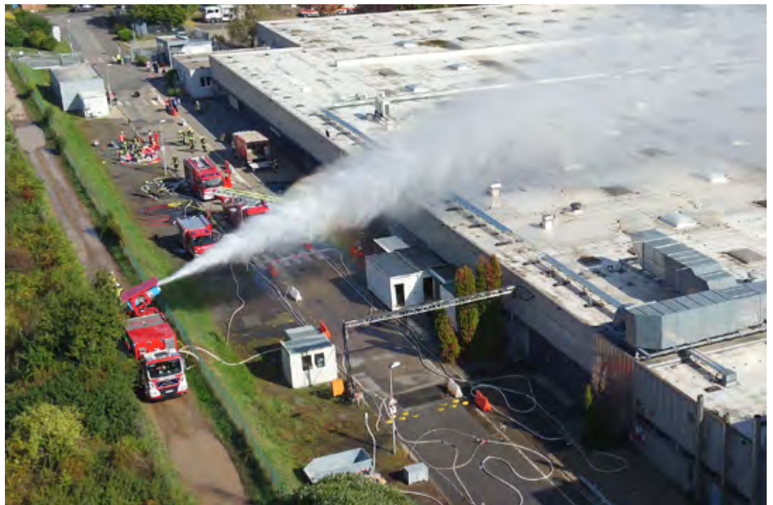
Während der Großübung auf dem Gelände von Dalli in Flörsheim-Dalsheim kam auch der Turbo-Löschler der Werksfeuerwehr Röhm zum Einsatz.

Derweil, noch vor der eigentlichen Brandbekämpfung, wurden in den Einsatzabschnitten Schutzmaßnahmen eingeleitet. Im Einsatzabschnitt