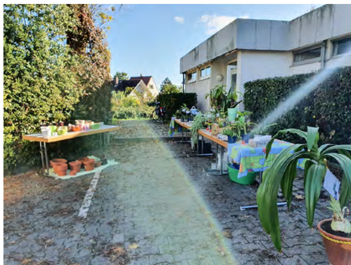
Im Herbst 2022 an der Turnhalle in Monsheim.

Unsere wiederverwendbaren „Grünen Aushänge“ mit weiteren Informationen hierzu findet man an verschiedenen Stellen in der Verbandsgemeinde und im Wiegehäuschen, Alzeyer Straße „103“, Flörsheim-Dalsheim.