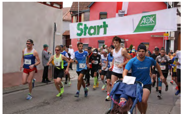
Start zum Lauf in 2022.