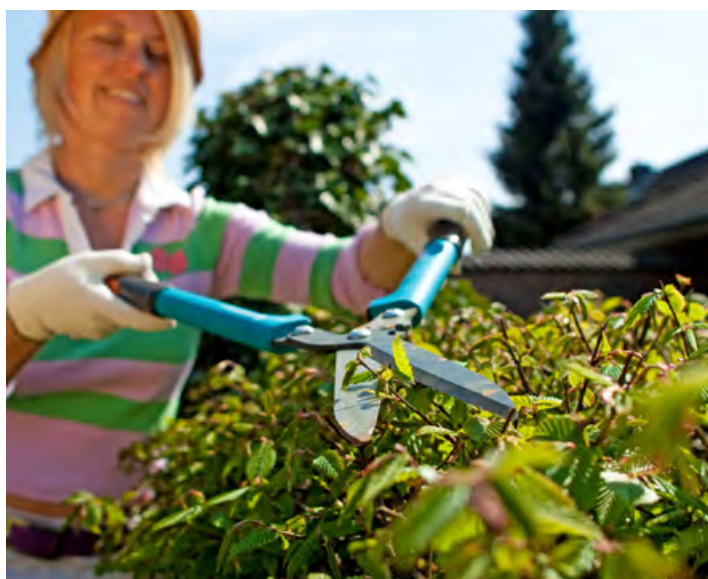
Auch während der Gartensaison gibt es viel zu tun, wie beispielsweise das Schneiden der Hecke. Was ist erlaubt und worauf muss ich dabei achten?