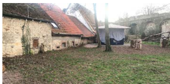
Noch liegt die WOIRASCHD im Winterschlaf.