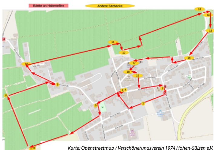
Karte: Openstreetmap / Verschönerungsverein 1974 Hohen-Sülzen e.V.

Gleichzeitig wird eine Bestandsaufnahme der Sitzbänke durchgeführt, damit anschließend ggf. Bänke repariert werden und neue Stellplätze gefunden werden.