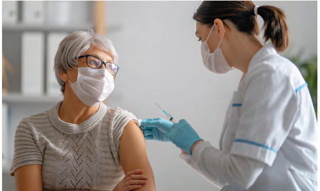
Die saisonale Grippeimpfung kann vor einer Infektion schützen und damit schwerwiegende Folgen verhindern. Die STIKO empfiehlt sie vor allem Menschen ab 60 Jahren.

Am besten melden sich Menschen ab 60 Jahren rechtzeitig in ihrer