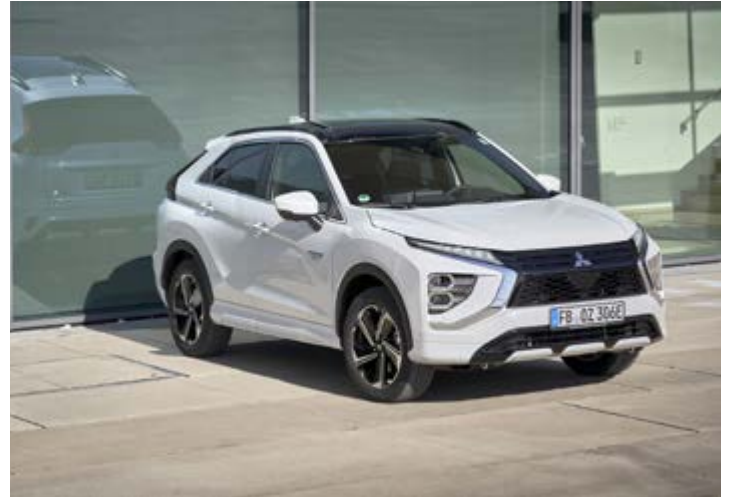
Mit unverwechselbarem Design und SUV-typischem Komfort bietet der Eclipse Cross ein einzigartiges Hybrid-Fahrerlebnis.

radantrieb. Sein unverwechselbares Design wird kombiniert mit SUV-typischem Komfort sowie dem einzigartigen Hybrid-Fahr-