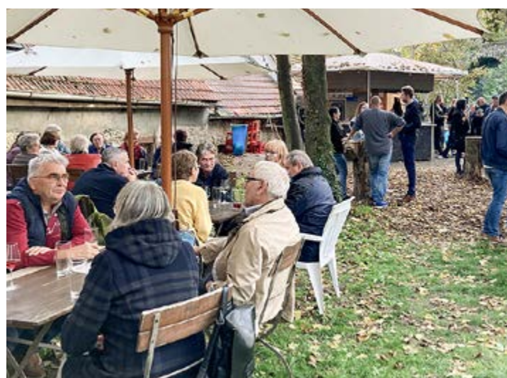
... das letzte Mal für dieses Jahr an der „Woiraschd im Dalsemer Parrgaade“

Die „Woiraschd im Dalsemer Parrgaade“ öffnete ein letztes Mal am letzten Wochenende – 22./23. Oktober anno 2022 – und zog bei strahlendem Wetter nochmals viele Besucher an den Weinstand. Die Bewirtschaftung übernahm dieses letzte Mal die „Holzmafia und Freunde“. In bewährter Weise und, wie uns allen bekannt, bewirteten die fleißigen Burschen und holden Weibsen die Gäste, denn es gab viel zu tun. Der Riesensmoker war in Betrieb, um die wohlschmeckenden Steakbrötchen, Hacksteaks und Pfefferbeißer zuzubereiten, die auch reißenden Absatz fanden. Komplettiert wurde dieser Wohlgenuss durch die edlen Tropfen unserer heimischen Winzer. Herold Heinz und alle Gäste belohnen diesen Einsatz mit einem heftigen Händeklapper.